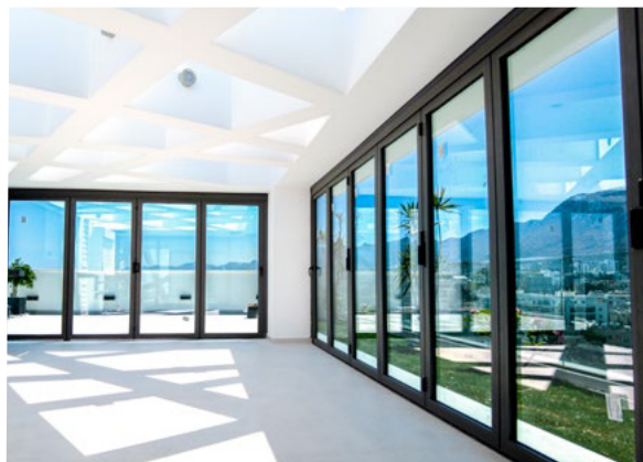
SS Natural 70 XTRM