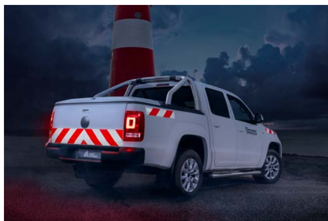
Chevrons réfléchissants Blanc/Rouge Avery Dennison® pour le marquage de véhicule, en conformité avec les normes DIN30710 et TPESC-B.

AVERTISSEMENT - Toutes les déclarations, les informations techniques et les recommandations d'Avery Dennison sont fondées sur des tests estimés fiables, mais ne constituent aucunement une garantie. Tous les produits Avery Dennison sont vendus selon les conditions générales de vente d'Avery Dennison, se reporter à la page http://terms.europe.averydennison.com . Il incombe à l'acheteur de déterminer de façon indépendante l'adéquation du produit pour l'utilisation prévue.