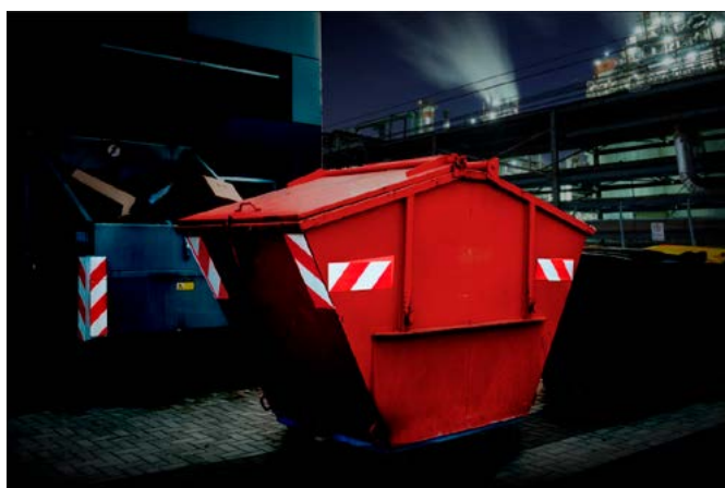
Chevrons réfléchissants Blanc/Rouge Avery Dennison® pour le marquage de conteneur.

* Notez qu'une autorisation spéciale est requise pour utiliser les bandes fluorescentes jaunes/rouges sur les véhicules d'urgence.