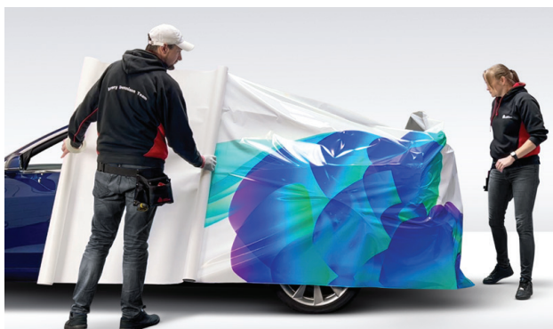
Repositionnement facile grâce à la technologie Easy Apply™ et un faible tack initial.