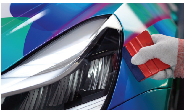
Excellente conformabilité 3D pour les projets de covering complexes e de véhicules et de flottes.