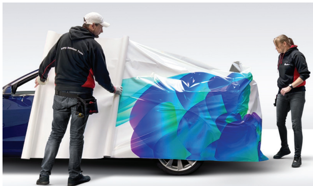
Facilidad de reposicionamiento gracias a la tecnología Easy Apply™ y al bajo agarre inicial.