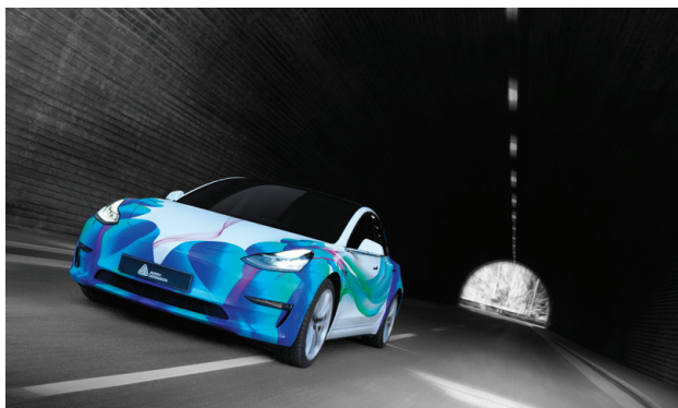
Excelente durabilidad en exterior, hasta 10 años sin imprimir y 6 años impreso*.