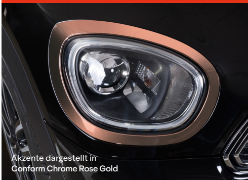
Akzente dargestellt in Conform Chrome Rose Gold

Bringen Sie Ihr Design mit effektvoll spiegelnden Chrome Details zum Glänzen!