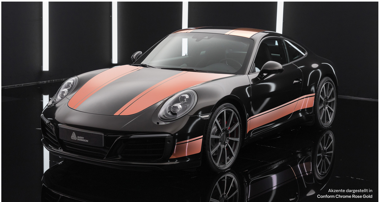
Akzente dargestellt in Conform Chrome Rose Gold